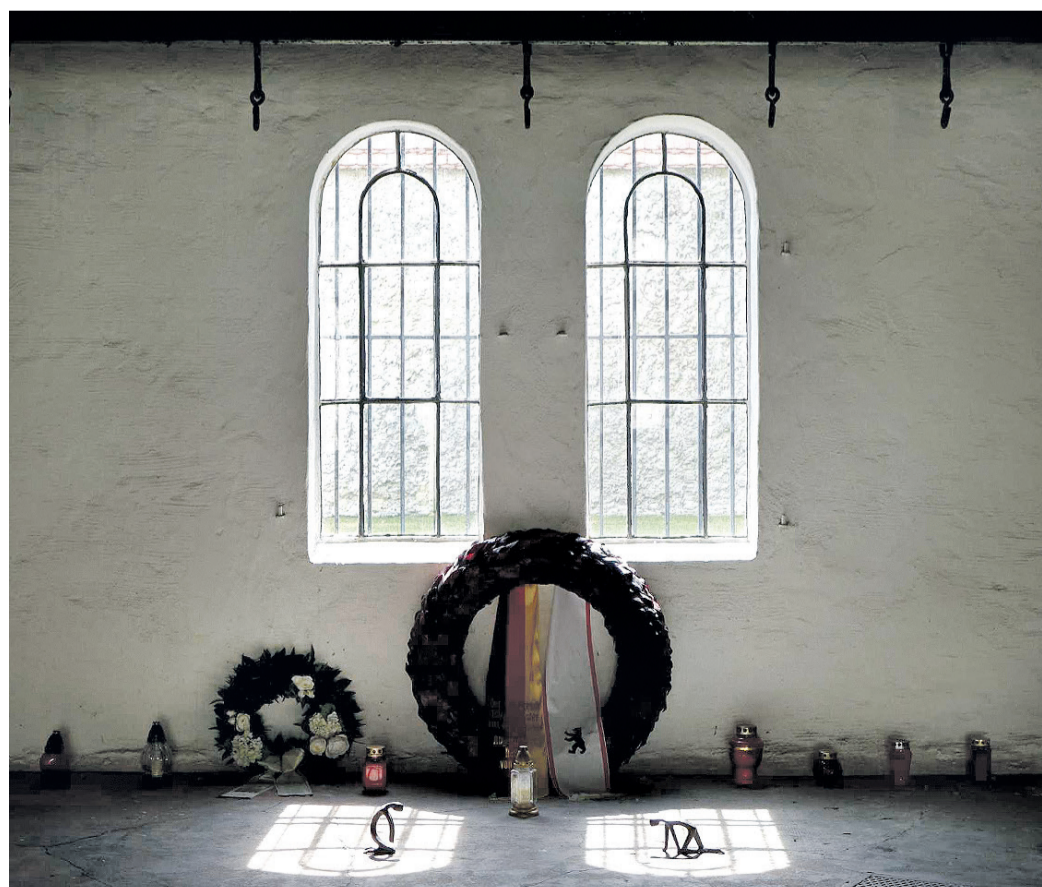
...vor den Fleischerhaken in Plötzensee.