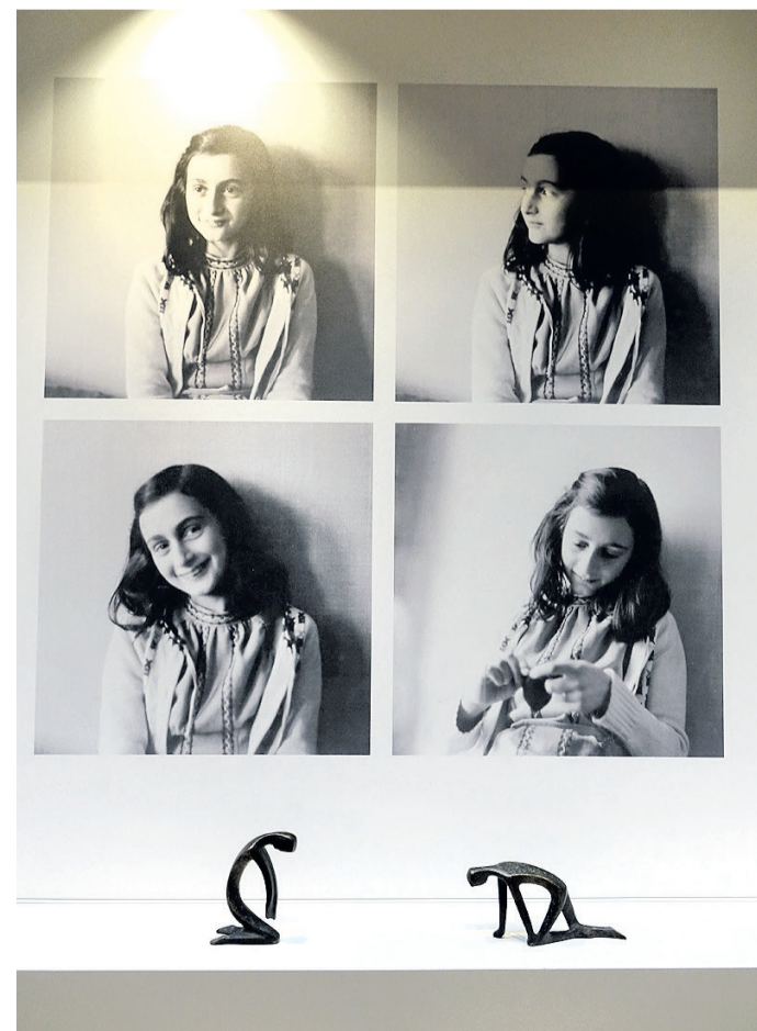
...im Anne-Frank-Haus in Amsterdam.